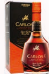
903017 BRANDY CARLOS