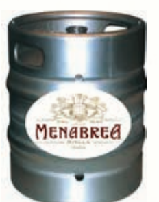
320156 MENABREA ROSSA