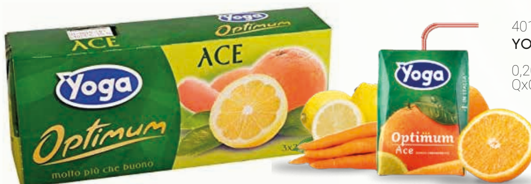
401033 YOGA ACE