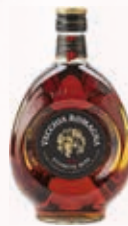
903010 BR. VECCHIA ROMAGNA ET. NERA