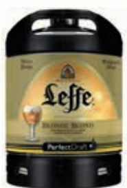
318300 LEFFE BLONDE