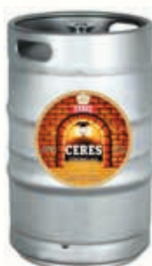
317150 CERES STRONG ALE