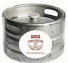
329172 PERONI G.RISERVA RED