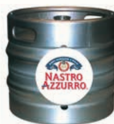
302150 NASTRO AZZURRO