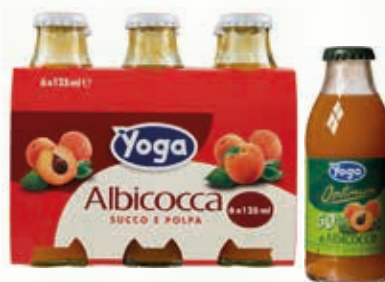
401003 YOGA ALBICOCCA