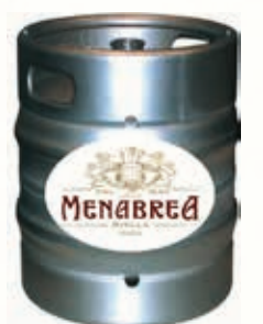
320151 MENABREA CHIARA