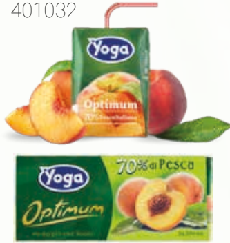
YOGA ALBICOCCA 0,20 litri QxC: 24