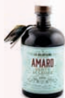
904095 DENTE DEL LEONE