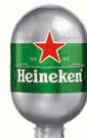
311140 HEINEKEN BLADE