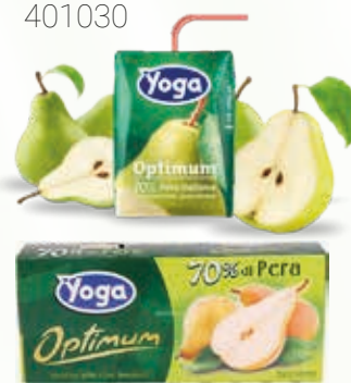
YOGA PERA 0,20 litri QxC: 24