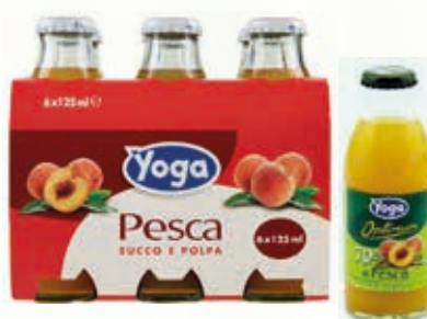
401002 YOGA PESCA