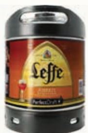
318302 LEFFE AMBREE