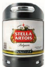
318310 STELLA ARTOIS