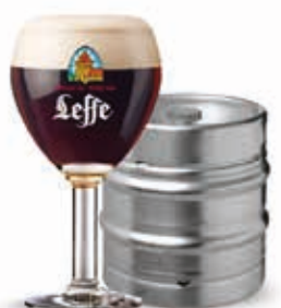
318281 LEFFE ROUGE