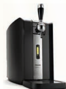
ZP19050 SPILLATORE PHILIPS INBEV