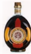
903013 BR. VECCHIA ROMAGNA CLASSICA