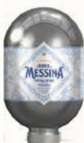
312730 MESSINA CRIS. SALE