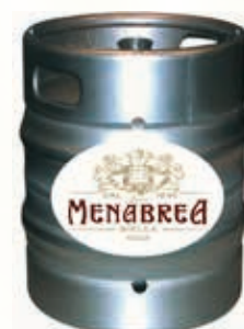
320155 MENABREA AMBRATA