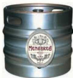
320150 MENABREA CHIARA