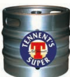
328150 TENNETT'S SUPER