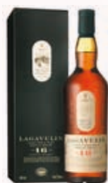
905100 WHISKY LAGAVULIN 16Y