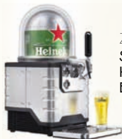
ZP19060 SPILLATORE HEINEKEN BLADE