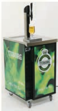
VA00001 SPILLATORE CARLSBERG FLEX