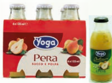
401001 YOGA PERA