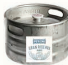
329180 PERONI G.RISERVA BIANCA