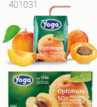
YOGA PESCA 0,20 litri QxC: 24