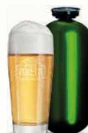
321180 BAP 4 LUPPOLI