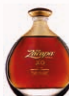
907338 ZACAPA XO